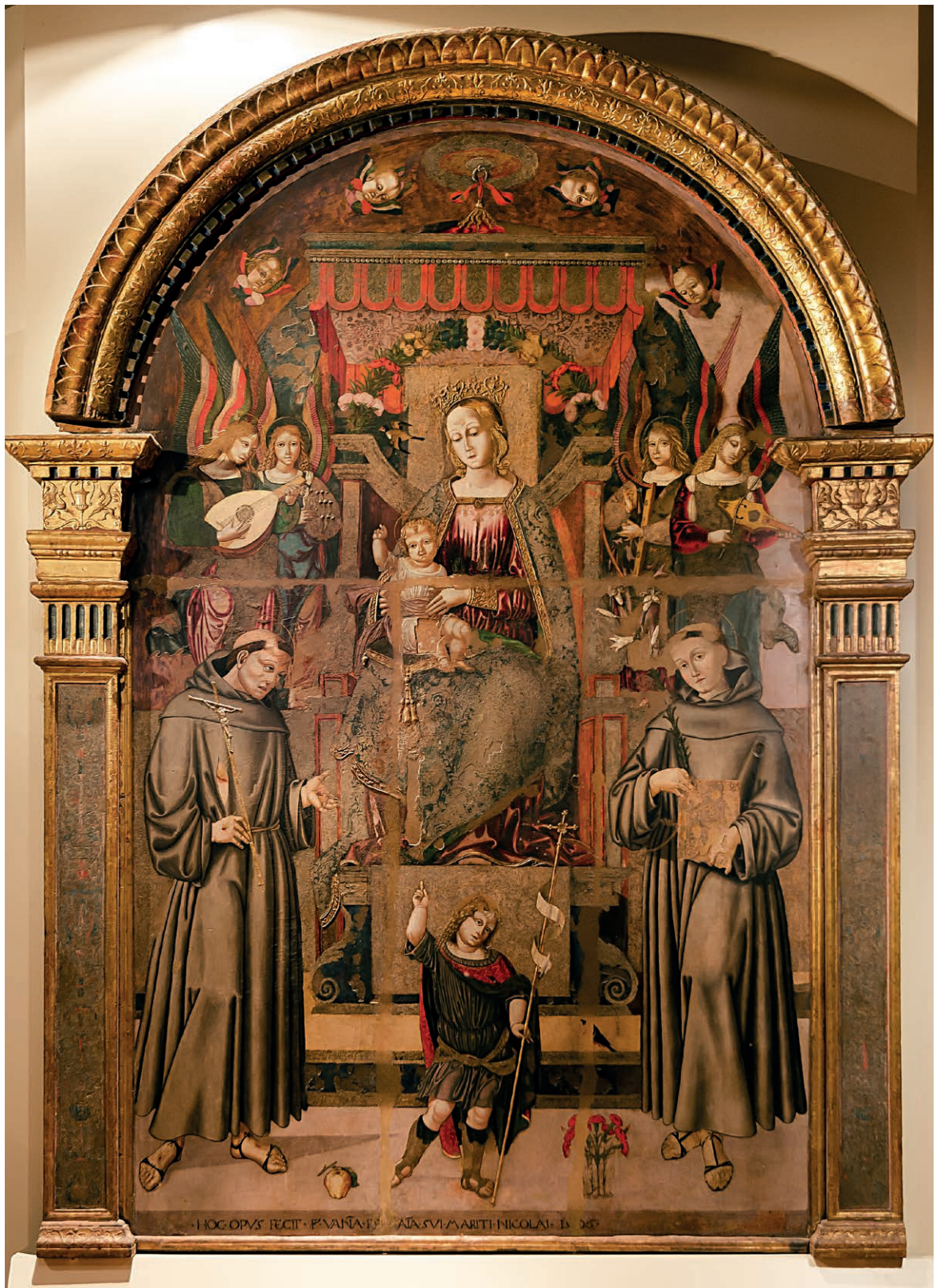
Fig. 2 - Potenza Picena, Pinacoteca Comunale, Bernardino di Mariotto: Madonna in trono con Angeli e Santi.